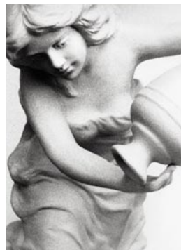
La locandina del Città di Thiene