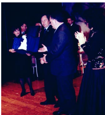
La consegna del premio a Thiene

premio è stato assegnato "Alla Fondazione e alle migliaia di volontari che condividono con lui ogni giorno la sfida per cancellare la parola leucemia ".