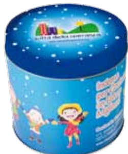
Latta del panettone