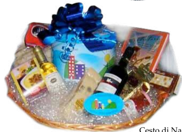
Cesto di Natale

Sul sito internet www.cittadellasperanza.org si possono visionare i dettagli.