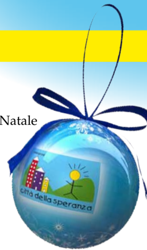
Pallina albero di Natale