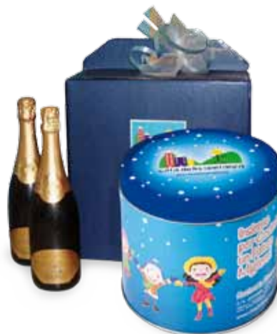
Scatola completa di Panettone e bottiglia di vino