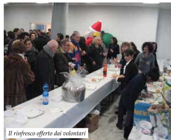
Il rinfresco offerto dai volontari