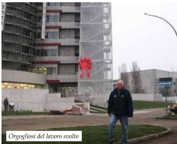
Orgogliosi del lavoro svolto