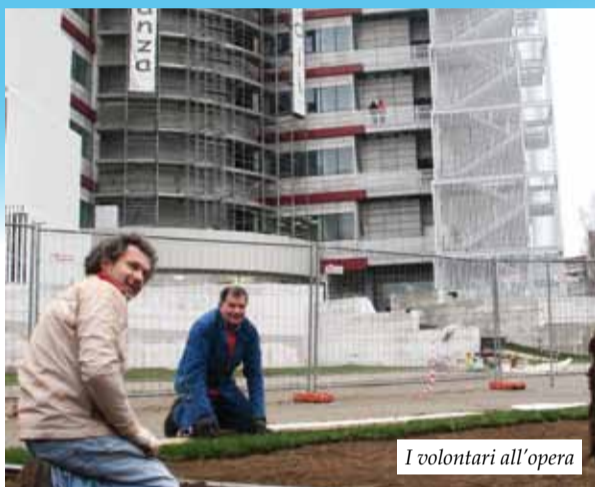
I volontari all'opera